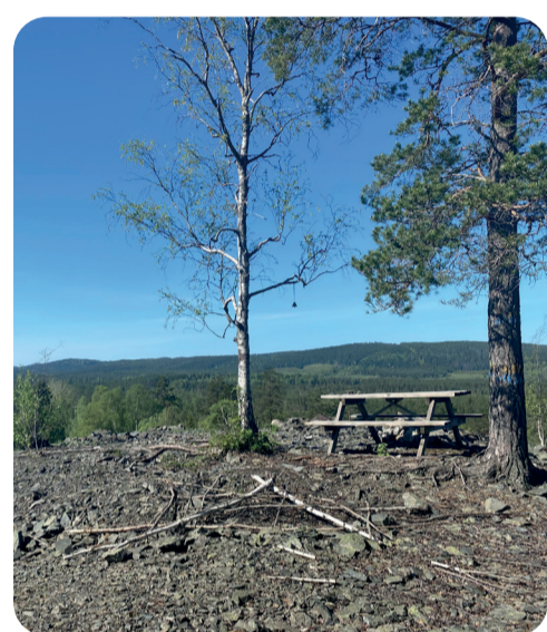
Utsiktsplats Västra fältet Viewpoint Västra fältet (Western Field)