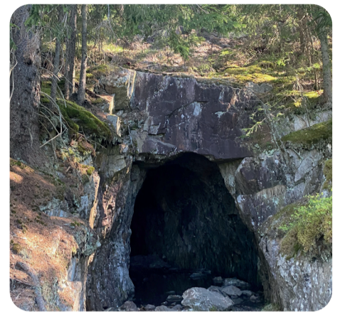
Kristinastollen, gruvhål Kristinastollen (mine hole)

var hårt och farligt, och många av arbetarna var fattiga bönder och andra människor som sökte arbete. Runt gruvorna växte det fram samhällen med bland annat skolor, handelsbodas och andra verksamheter.