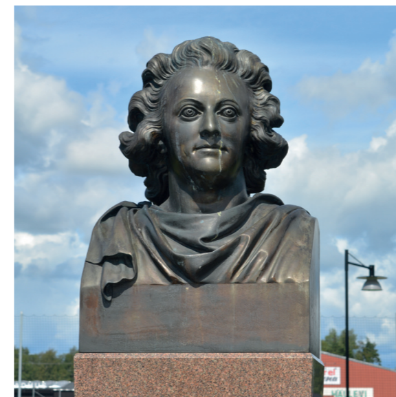
Johan Tobias Sergel, Gustav III