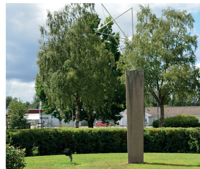
Balansakt av Veikko Keränen

I parken ser du hans skulptur Balansakt.