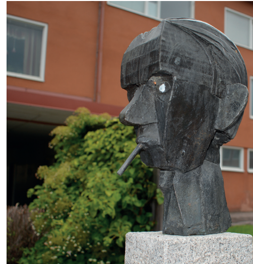
Ferlin av KG Bejemark

Självsäger han: ”Många har uppgifterna varit, arbetar ofta med kontraster, mellan tjockt och tunt, mellan tungt och lätt, mellan starkt och svagt.”